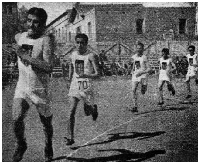
El equipo catalán vencedor en Madrid en una exhibición posterior.