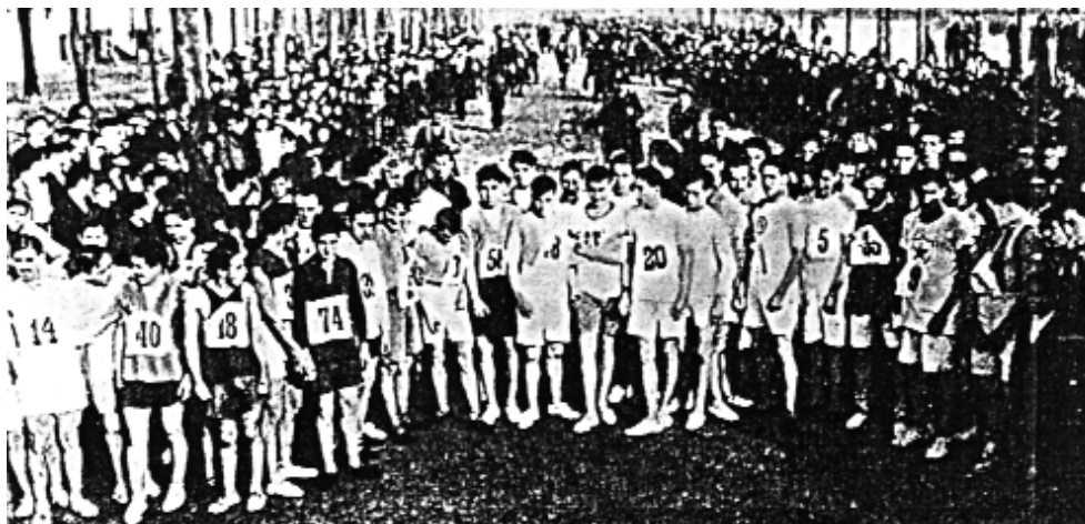
Salida de la prueba disputada en San Sebastián el 26 de noviembre de 1916.