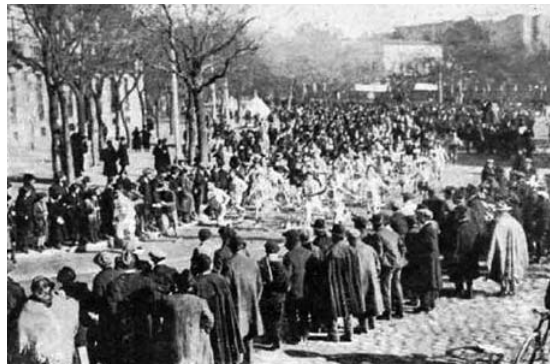
Salida de la primera edición del Campeonato de España de campo a través en la plaza de Colón de Madrid.

nes. Con tanto retraso se exponían a una derrota eminente. El temor al fracaso les obligó a adoptar otra determinación un tanto peligrosa: se reunieron en asamblea sin dejar de correr. Deliberaron, expusieron a Mestres sus propósitos y los aceptó; se pusieron tan contentos los tres. Pero llegó el momento culminante. No podían abandonar a su compañero sin más ni más, y le conminaron a que pasara lo que pasara no abandonaría la carrera. Juró que no abandonaría y que llegaría a la meta.