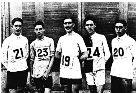
Algunas de las formaciones más conocidas de la primera época del campo a través en Madrid. Arriba los integrantes de los clubes Sociedad Deportiva Obrera, Sociedad Cultural Obrera y a la derecha el M.Z.A.